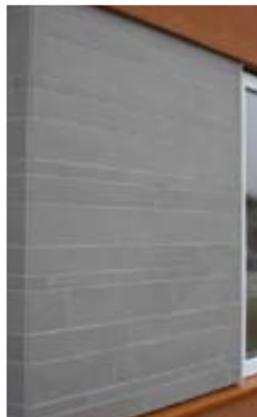
Mosa tegel "Terra Maestricht" afgewerkt in een TS1-patroon.

Het project is goed verlopen, mede dankzij de voorbereiding. Tijdens een uitgebreide voorbereiding zijn de details nauwkeurig met Aannemersbedrijf Jongen (Landgraaf) afgestemd, wat effect heeft gehad op de positieve verloop van het afwerkproces.