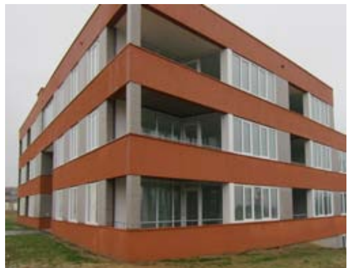
Het uiteindelijke resultaat is bereikt door verschillende stroken te creëren: sierpleister wordt afgewisseld met tegelafwerking.

Het StoTherm Vario systeem met tegelafwerking is niet alleen op decoratief niveau een goede keuze. Ook op de lange termijn biedt dit systeem zekerheid, zo blijkt ook uit de 10 jaar niet aflopende verzekerde garantie die op dit systeem gegeven kan worden (SGG o.g.).